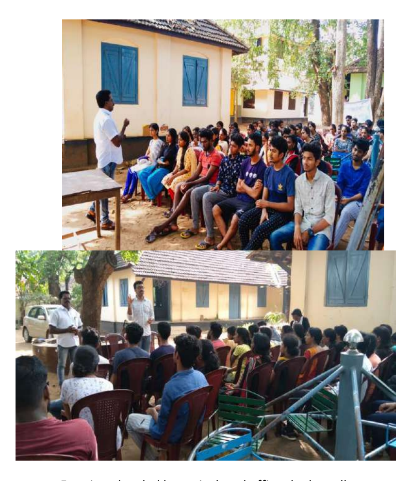
Farming-class led by agricultural officer,kodungallur