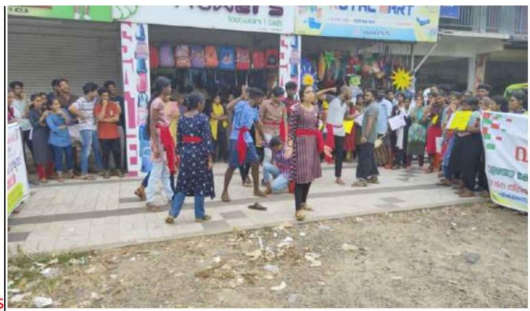
STREET DRAMA by NSS students