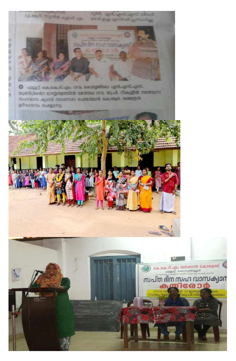
Topic-Women security rules –