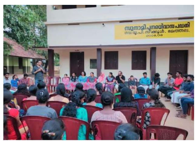
NSS ALUMINI @CAMP