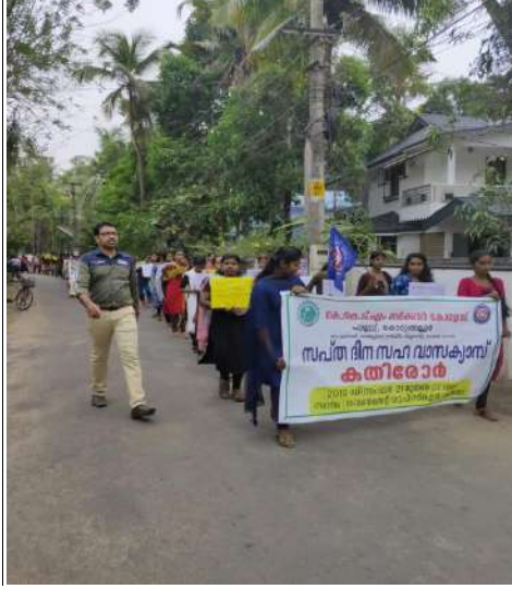
LAHARI VIRUDHA RALI-inaugurated by circle inspector of police, Padmakumar-23.12.19