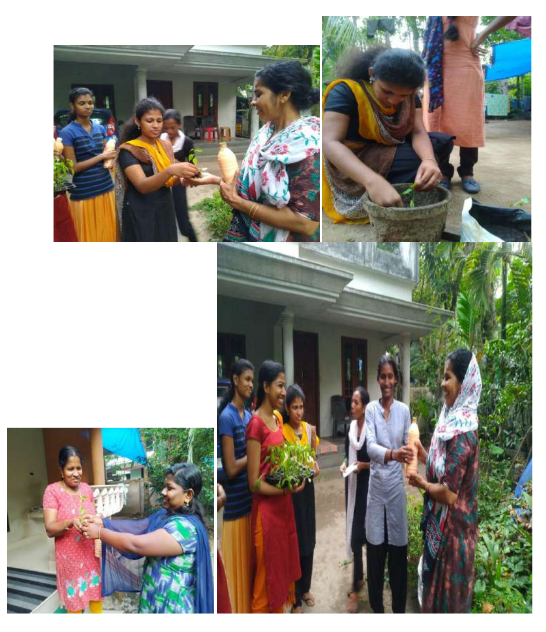
Distribution of plants and cleaning powder