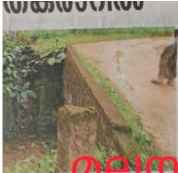
മുൻ മാതൃകയിലുള്ള പണി തുടങ്ങിക്കൊണ്ടിരിക്കുന്ന കെട്ടിടം

ഇതുവരെ ഇവിടെ നിന്നും പണി തുടങ്ങിക്കൊണ്ടിരിക്കുന്നു. ഇവിടെ നിന്നും പണി തുടങ്ങിക്കൊണ്ടിരിക്കുന്നു. ഇവിടെ നിന്നും പണി തുടങ്ങിക്കൊണ്ടിരിക്കുന്നു.