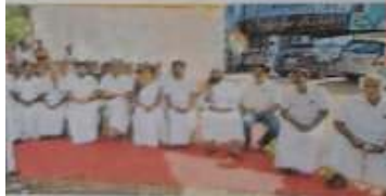
കോർപ്പറേഷൻ ഓഫീസിൽ നടത്തിയ യോഗത്തിൽ പങ്കെടുത്ത എംപിമാർ

കോർപ്പറേഷൻ ഓഫീസിൽ നടത്തിയ യോഗത്തിൽ പങ്കെടുത്ത എംപിമാർ. കോർപ്പറേഷൻ ഓഫീസിൽ നടത്തിയ യോഗത്തിൽ പങ്കെടുത്ത എംപിമാർ.